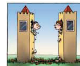
Omgevingscommunicatie: Hoe krijg je iedereen mee?

Hoe zorg je voor afstemming en regie op de communicatie? Het grote Windpark Noordoostpolder is een goed voorbeeld. Bij zo'n groot windpark is inzicht in de belangen van partijen uiteraard cruciaal: welke positie nemen betrokkenen in en aan welke informatie is er op welk moment behoefte? Dit leidt tot een heldere aanpak en een soepele samenwerking tussen Rijks- Provinciale en gemeentelijke overheid én de initiatiefnemers.